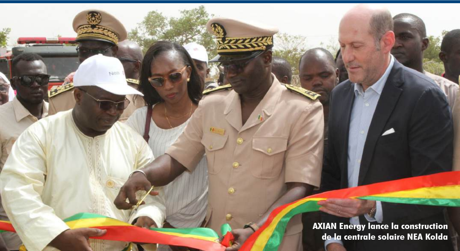
AXIAN Energy lance la construction de la centrale solaire NEA Kolda

Avec NEA Kolda, AXIAN Energy réaffirme sa conviction : l'accès à l'énergie est un moteur de développement pour les communautés. Cette première pierre marque le début d'un élan collectif, où chaque kilowatt produit ☑ contribue à construire un avenir plus juste et plus inclusif - fer